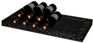
Mittelablar 65 ca. Fl 20 Stk 65 / 5 / 30 cm 15 kg SFr. 36.00