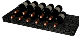
Seitentablar 71 ca. Fl 20 Stk 71.5 / 5 / 30 cm 15 kg SFr. 36.00